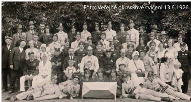
Foto: Veřejné okreskové cvičení 13.6.1926.